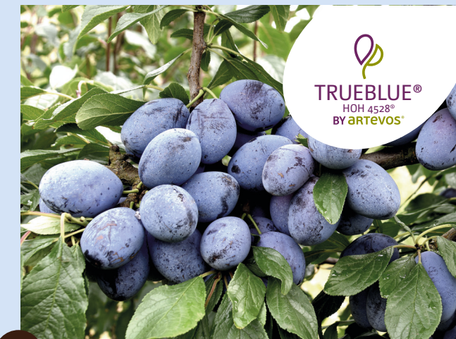
TRUEBLUE® HOH 4528® die Treue

aromatisch – fest – ertragreich – robust