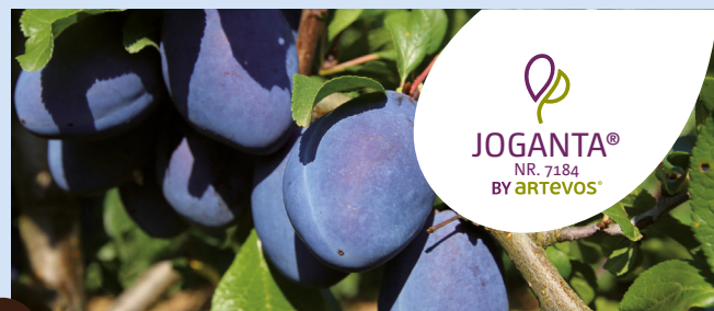
JOGANTA® NR. 7184® die Resistente

HINWEISE: Scharfer Schnitt und intensive Ausdünnung unbedingt empfohlen, scharkatolerant