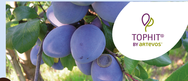
TOPHIT® die Große

scharkatolerant – großfrüchtig – aromatisch – produktiv