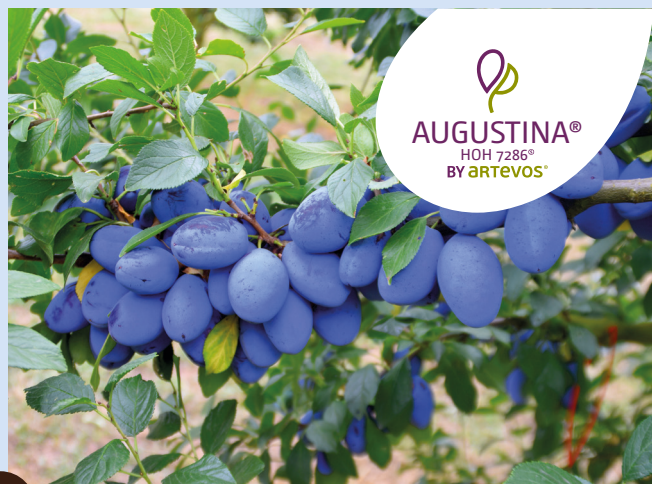
AUGUSTINA® HOH7286® die Produktive

groß – produktiv – steinlösend – aromatisch