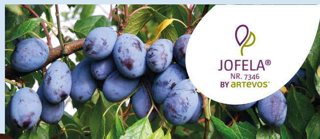
JOFELA® NR. 7346® die Längliche

HINWEISE: für die Frischvermarktung geeignet