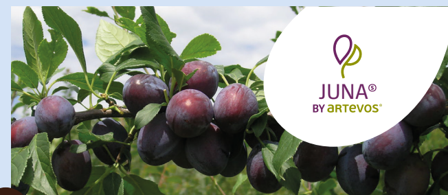
JUNA® die Frühe

HINWEISE: langes Erntefenster, frostempfindlich