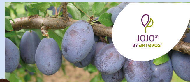
JOJO® die Reichtragende

HINWEISE: scharkatolerant, langes Erntefenster, guter Geschmack, nicht für kalte Standorte geeignet