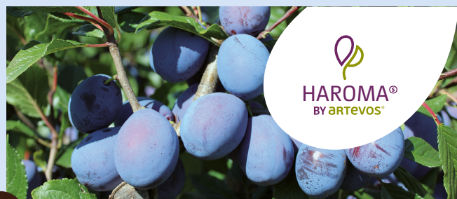
HAROMA® die Aromatische

HINWEISE: mittelstarker Wuchs, steiles Wachstum, bei Vollertrag Astbruch möglich, anfällig für Holzkrankheiten und Scharka, selbstfruchtbar