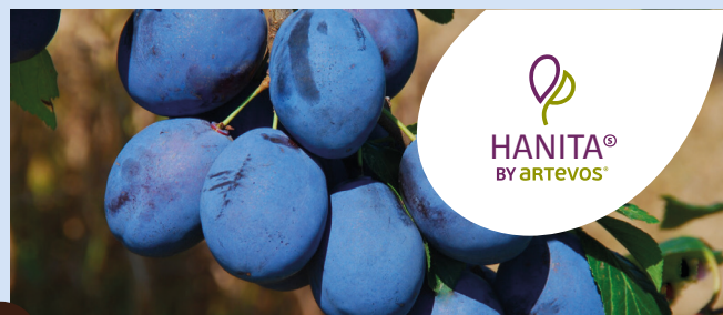
HANITA® die Schmackhafte

HINWEISE: geringe Blütenfrostopfindlichkeit, kein Vorerntefruchtfall, bei guter Ausdünnung gleichzeitige Reife aller Früchte