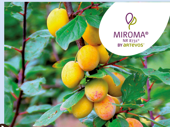
MIROMA® die Attraktive

UMFASSENDES SORTIMENT für höchste Ansprüche