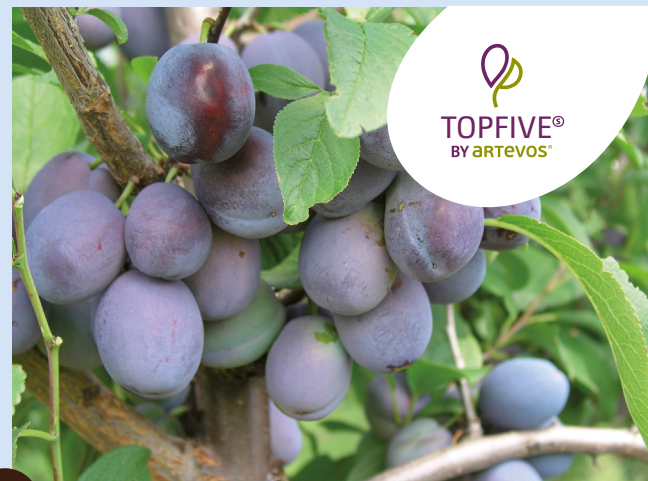
TOPFIVE® die Saftige

robust – aromatisch – fest – ertragreich