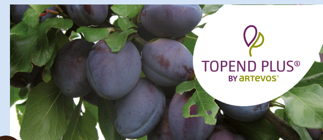
TOPEND PLUS® die Späte