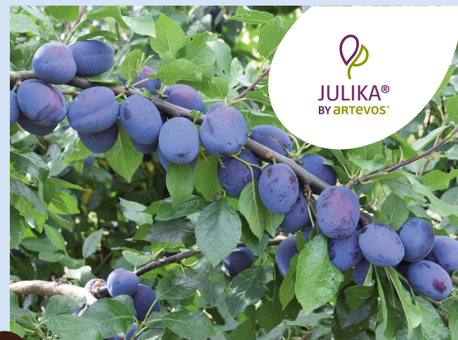
JULIKA® HOH8679® die Süße

HINWEISE: hitzeresistent, Ausdünnung empfohlen, sonst kleinere Früchte als 'Katinka'